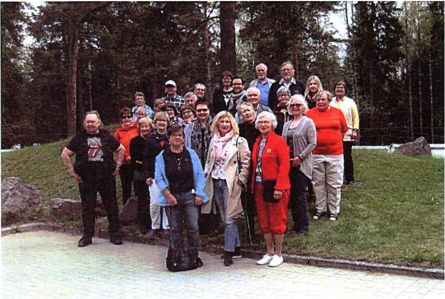
Sukuseuran matkalla Karjalaan keväällä 2017