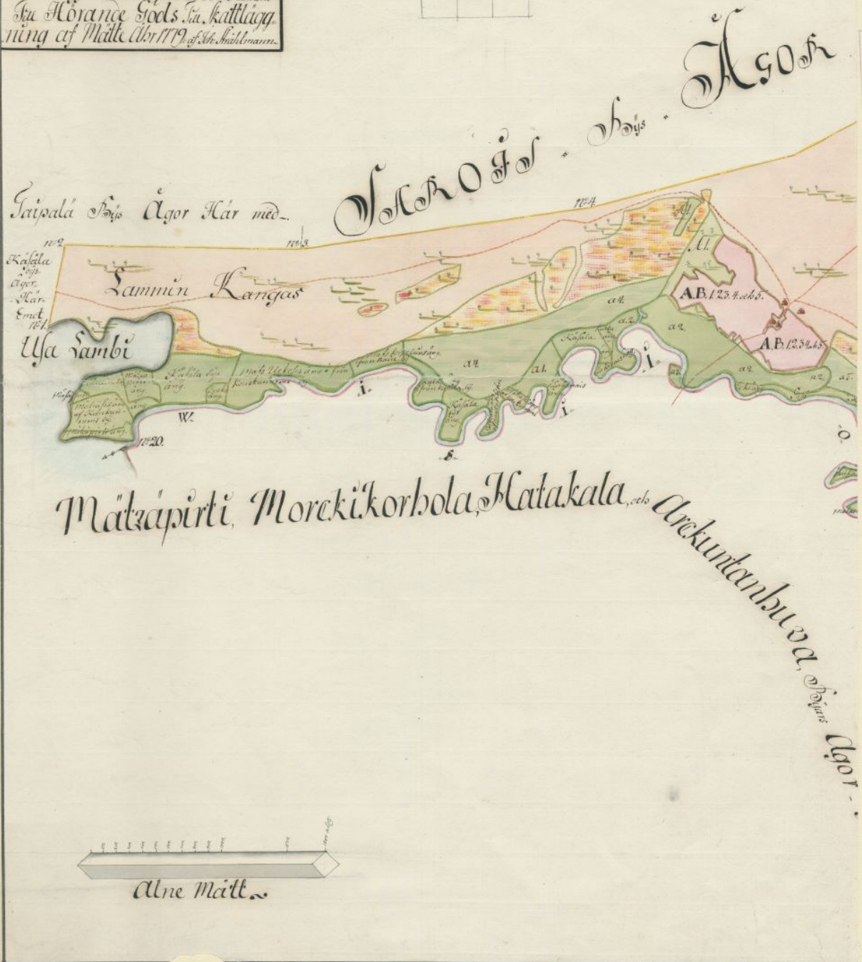
v.1779 Wanhajama, AB: Ahtiaisten ja Peltosten talot Viisjoen varrella