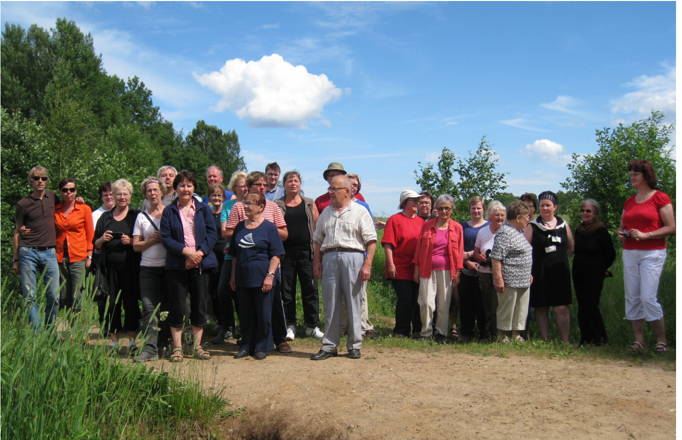
2010 Metsäpirtissä Vaskelan koskella sukuseuran matkan osanottajia