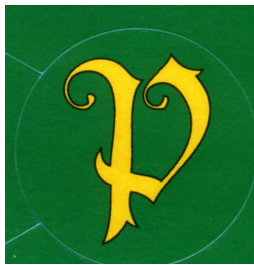
Ehdotus 1 Fraktuura P

Tulevassa sukukokouksessa valitaan näistä kolmesta ehdotuksesta sukuseuramme tunnus.