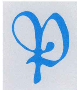
Ehdotus 2b Tyylitelty kirjurin P