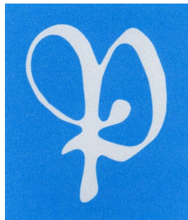
Ehdotus 2a Tyylitelty kirjurin P